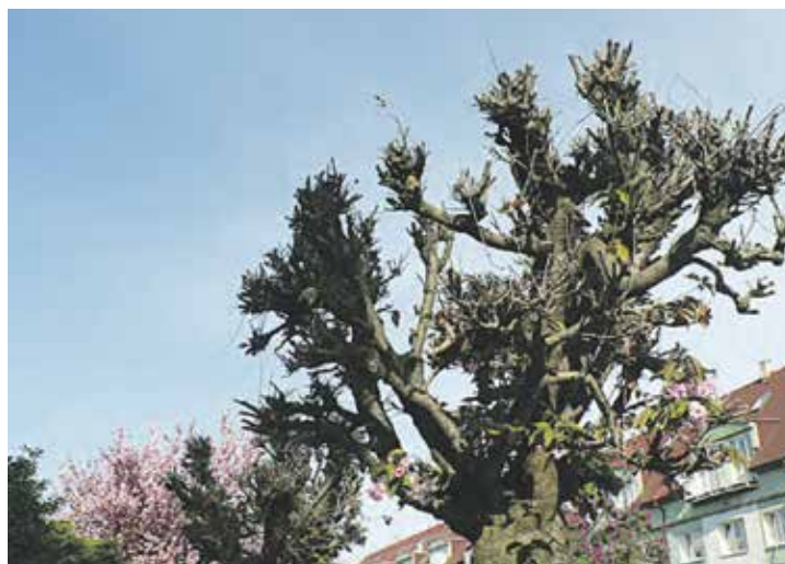
Sakury na severní straně ulice Dudkovy nedávno zašly.

Další případ se týká ulice Šumperské. Tato ulice byla původně lemována hustě vysazenými vzrostlými stromy. Avšak blízkost stromů k oknům bytového domu vadila obyvatelům spodních pater. V reakci na to byly stromy nahrazeny stálezelenými rododendrony.