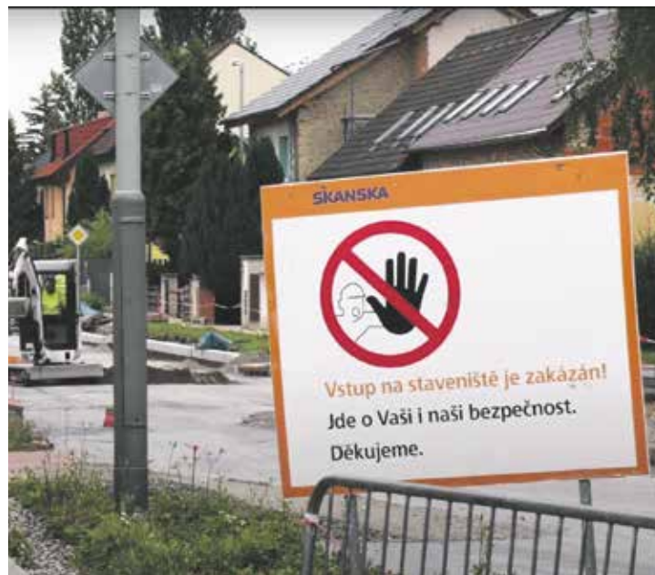
Čakovická radnice se rozhodla nečekat na magistrát a do rekonstrukce některých ulic se pustila sama.

U větších oprav musí vedení radnice spolupracovat s magistrátem.