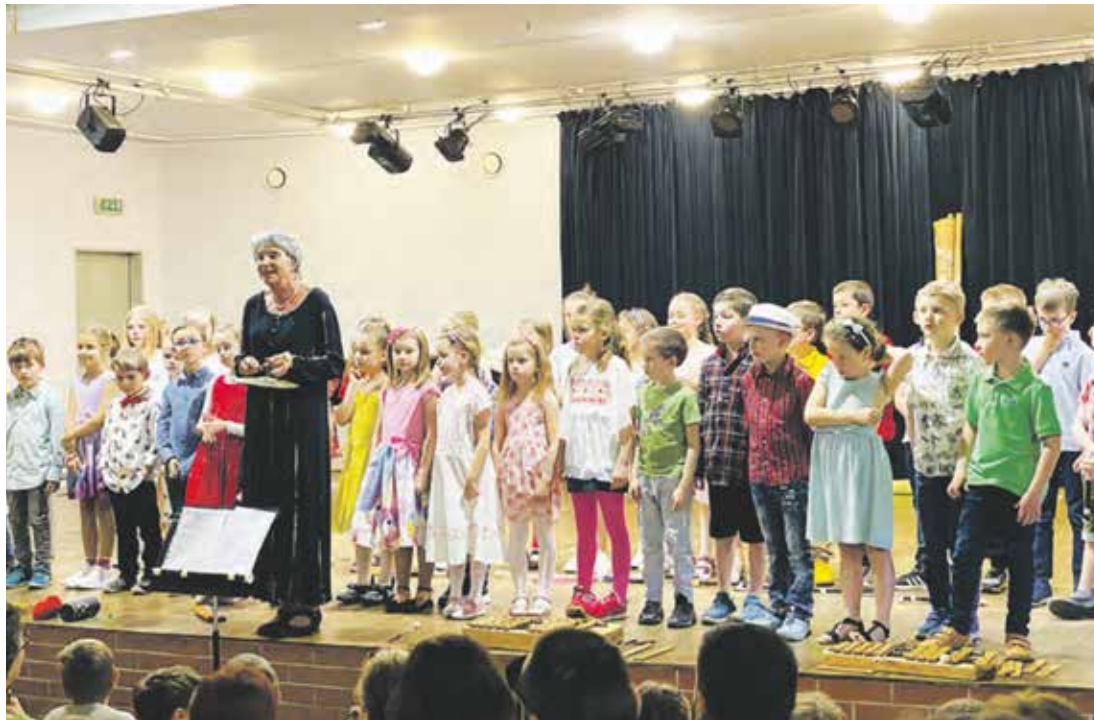
Hudební svátek, koncert orchestru HRAJETO se konal v den výročí úmrtí Bedřicha Smetany.