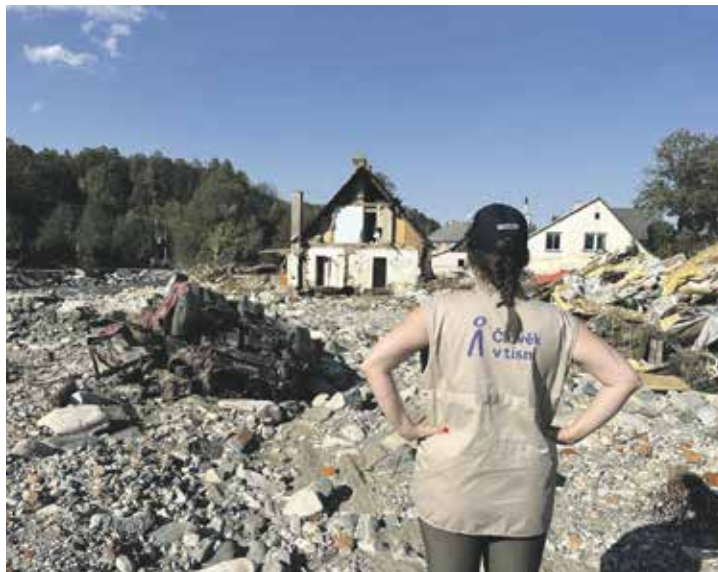
První pomoc po povodních lidé v zasažených oblastech dostali, obnova regionu ale potrvá dlouho a bude stát mnoho peněz.

Tlaková níže Boris, která vznikla na začátku září nad severní Itálií dorazila v polovině měsíce nad území Česka. Dlouhotrvající deště překonaly i 127 let starý rekord, když 14. září v Loučné nad Desnou na Šumpersku napršelo 386 litrů vody na metr čtvereční. Zasažen byl ale celý severovýchod republiky, především Jesenícko, Šumpersko, Opavsko, s velkou vodou se potýkaly ale i Krkonoše nebo Jihočeský kraj. Díky včasné výstraze stihli vodohospodáři upustit vodu z většiny přehrad, a ochránili tím životy i majetek lidí v regionech. Hasiči, jak profesionální tak dobrovolní, ze sebe vydali maximum a po záchranných pracích se k nim připojily další složky IZS a organizace a všichni se pustili do odstraňování následků povodní. „Díky vrtulníkům, člunům, speciální technice a odbornému výcviku našich příslušníků jsme zachránili téměř 250 lidí. Po opadnutí vody jsme začali likvidovat následky povodně, pracovali jsme na odstranění nebezpečných stavů, obnově infrastruktury, dodávali jsme lidem humanitární pomoc a koordinovali první