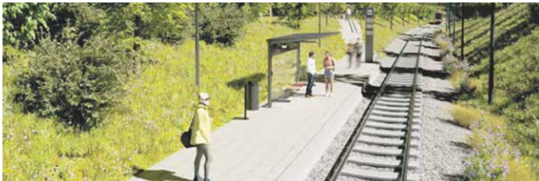
Díky odkupu posledních pozemků může být stavba tramvajové tratě zahájena.

Cestující v Praze se už v příštím roce svezou po nové tramvajové trati. Trasa propojí Olšanskou ulici s Habrovou, měří téměř dva kilometry a obslouží vznikající zástavbu Žižkov City i Parkovou čtvrtí.