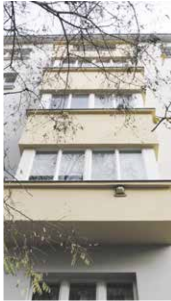
Na radnici se obrací lidé, kteří upozorňují na problémy v městských bytech.

Zastupitel Filip Nekola (ODS) tlumočil stížnosti z domu v ulici Jana Želivského. Podle zpráv od zástupce tamního SVJ dochází k opakovaným fyzickým útokům, porušování nočního klidu i domovního řádu. Dále uvádí, že byt v městské části se stává útočištěm pro drogově závislé. „Každý, kdo má alespoň základní zkušenost s podporovaným bydlením, musel vědět, že bez jasných pravidel a kontroly to skončí průšvihem. Městské byty by se měly přidělovat prioritně podporovaným profesím, jako jsou zdravotní sestřičky, policisté nebo mladé rodiny. Klíče od městského majetku skutečně nepatří do rukou drogovým dealerům a lidem, kteří nejsou