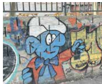
Trojka aktualizovala místa, kde je možné tvořit další legální graffiti.

Tvůrci využijí opěrné zdi ve třech úsecích Prokopovy ulice, na Vrchu svatého Kříže či u stadionu Viktorie Žižkov. Tvorba je povolena také v Malešické ulici, u plaveckého bazénu a na stěně úkrytu Bezovka u Parukářky. Vedení Prahy 3 očekává, že krok přinese