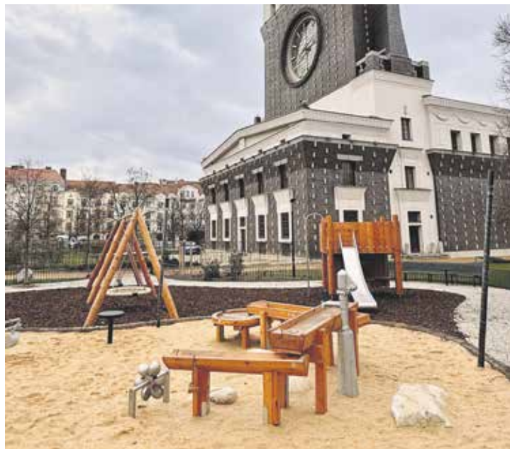
Nové hřiště je součástí rekonstrukce náměstí Jiřího z Poděbrad.