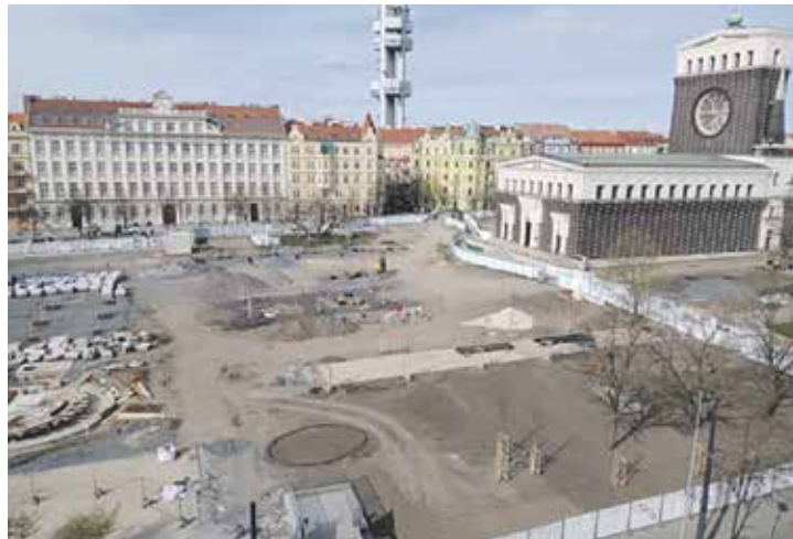
Proměna náměstí Jiřího z Poděbrad začala v lednu 2024.

„Rekonstrukce náměstí Jiřího z Poděbrad je ukázkovým příkladem špatného hospodaření a nezvládnuté komunikace ze strany radnice. Pro mě je cena za „vydláždění náměstí“ za půl miliardy těžko pochopitelná. Dalším problémem je doba realizace. Mnoho měsíců jsme viděli náměstí ztuhlou, kdy na místě nebyl jediný dělník. To je tím, že město dodavatele