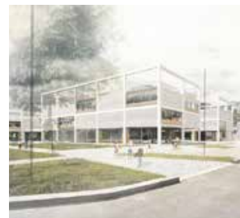
První kroky městské části ke zbudování školy začaly už v roce 2013.

Odbor investic na magistrátu současně řeší prověření ekonomické udržitelnosti celé stavby a připravuje takzvanou delimitaci. Tento krok znamená, že z městské části Dolní Měcholupy přejdou veškerá práva ze smluv přímo na hlavní město. To následně vypíše