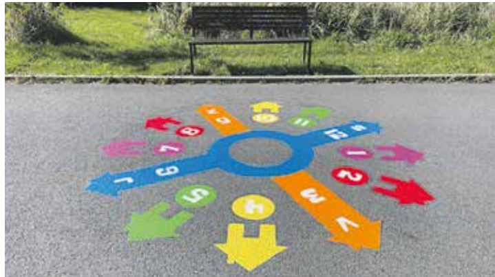
Městská část nyní plánuje samotnou realizaci výsledných návrhů. Loni to byly například hry na chodníku.

Stavební úpravy čekají také starší sportoviště. Čtvrtou pozici totiž vybojovala oprava