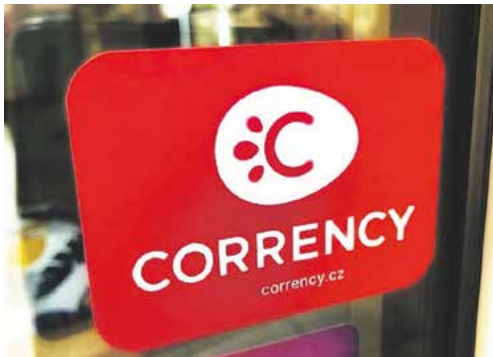
Letňany opět spouští projekt na podporu lidí a obchodníků žijících a působících na území této městské části.

Princip tohoto projektu je snadný. Úřad rozdělí přihlášeným lidem virtuální peníze, takzvané correny. Pokud občan nakoupí u registrovaného podnikatele nebo zaplatí dítěti kroužek, uhradí polovinu ceny ze svého a zbytek doplatí z tohoto virtuálního kreditu. Získá tak pedesátiprocentní slevu, přičemž prodejce dostane zaplacenou celou částku, protože druhou půlku mu bez prodlení doplatí přímo městská část. V minulosti se do projektu zapojily