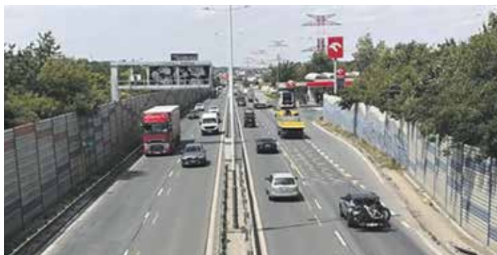
Práce na Kbelské ulici budou probíhat sedm dní v týdnu, největší nápor se očekává o prázdninách.

Podle poslední a finální varianty odstartují stavební úpravy na začátku července a vyžádají si svedení dopravy do jednoho