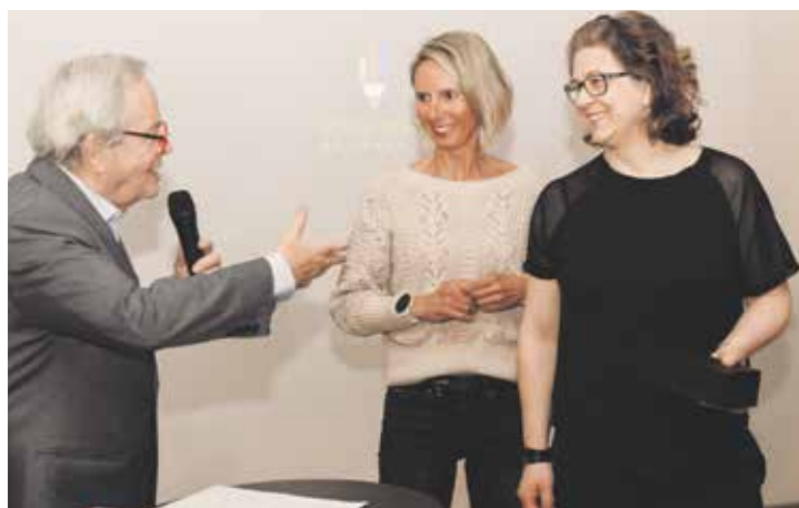
Ocenění Učitel roku uděluje městská část za to, co učitelé a zaměstnanci dělají pro děti každý den.

„Já bych jim chtěl poděkovat za jejich práci. Za to, že probouzejí právě tu zvědavost v dětech. A chtěl bych jim říct, že to má smysl. Chápu, že někdy je to složitě, náročné, to vím i sám doma. Myslím si, že radnice je tady od toho, aby jim umožnila jakékoliv možnosti, které tady máme,“ řekl starosta Zdeněk Kučera.