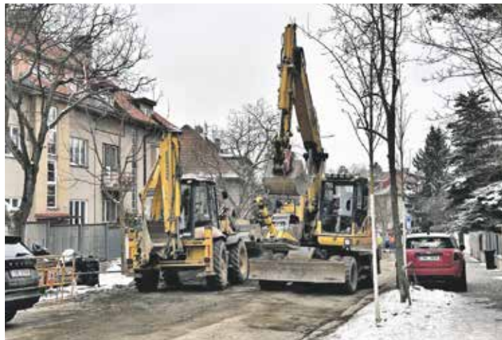
Hlavní město vyhlásí zakázku na rekonstrukci vodovodů a kanalizace.

Hlavní město zajistí rekonstrukci vodovodů, části