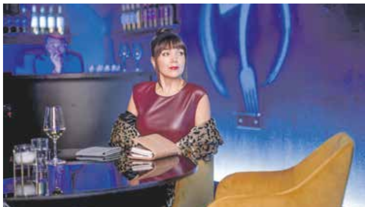
Lucie Vondráčková v roli obávané kritičky jidla v nové komedii Když se zhasne.

Sem tam něco zhltnu. Miluju žlutou papriku, voňavá rajčata a tiramisu. A na pleť okurku.