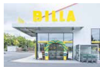
V rámci rozvoje obce Statenice bude otevřena nová pobočka Billy.

Výstavba nového komerčního objektu spadá pod developerský projekt s názvem Aura. Záměrem