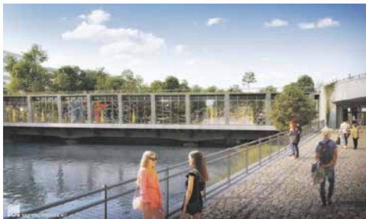
Spory o dostavbu metra D trvaly 2,5 roku, než úřady rozhodly. Vizualizace | Metroprojekt

Zdržení se promítne do ceny. Kvůli více než dvouletému odkladu se podle vedení města navýší náklady stavby vlivem inflace. Přesná částka zatím nebyla detailně vyčíslena, ale půjde