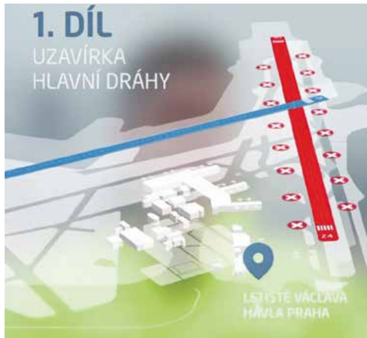
Hlavní dráhu uzavírá pražské letiště na 4,5 měsíce.

Podobné práce byly naplánované už loni, rozdělení do dvou let má technický důvod. Kdyby dělníci pracovali na obou stranách dráhy současně, letadla by ztratila potřebnou délku pro vzlet a celková uzavírka by zabrala přes