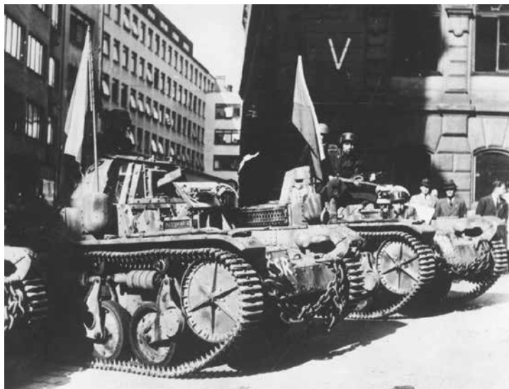
Souborná kniha je unikátním pohledem na okolí Prahy jako celek, a tím i na celou Prahu.

Délka a styl záznamů se liší. Množství detailů ovlivnila intenzita bojů v konkrétní obci, časový odstup od událostí i zkušenosti samotných kronikářů. Editoři tyto okolnosti vysvětlují v úvodu každé