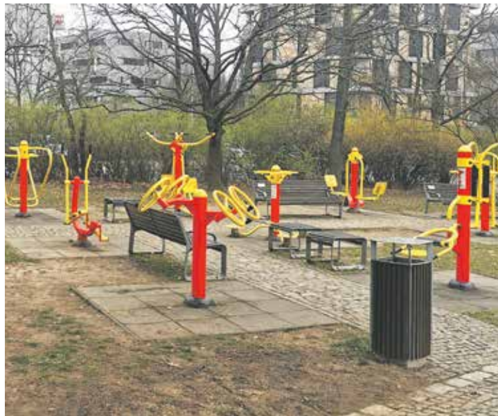
Jedním z návrhů je umístění fitness prvků u domova s pečovatelskou službou.

Předchozí ročník uspořádalo město v roce 2024 a vyčlenilo na něj stejnou částku. Sousedé tehdy svými hlasy podpořili instalaci pítka v Žalově a montáž nového zábradlí v Myší díře. Ta se nakonec neobešla bez větších investic,