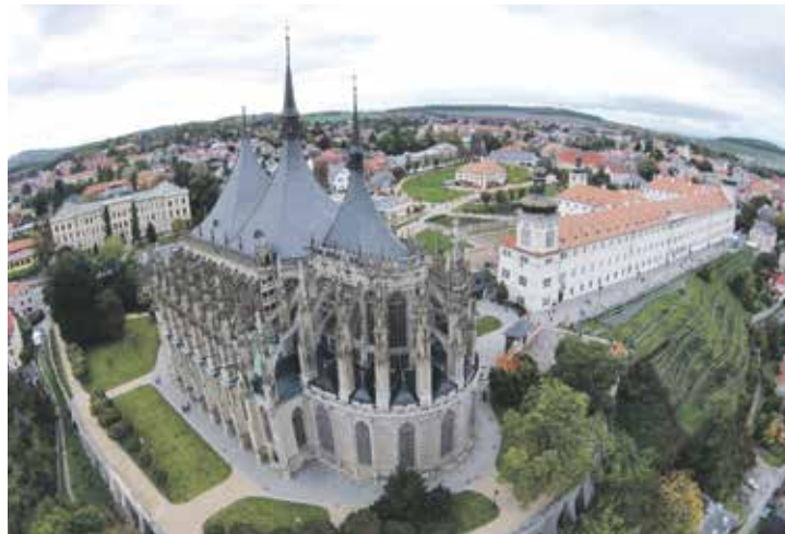
Chrám svaté Barbory v Kutné Hoře.

Stavba chrámu začala roku 1388 a byla několikrát přerušena. Do stavby zasáhly husitské války i další konflikty. Jeho podoba je výsledkem práce významných stavitelů, například Matěje Rejska a Benedikta Rejta. Každé období zanechalo na chrámu svou