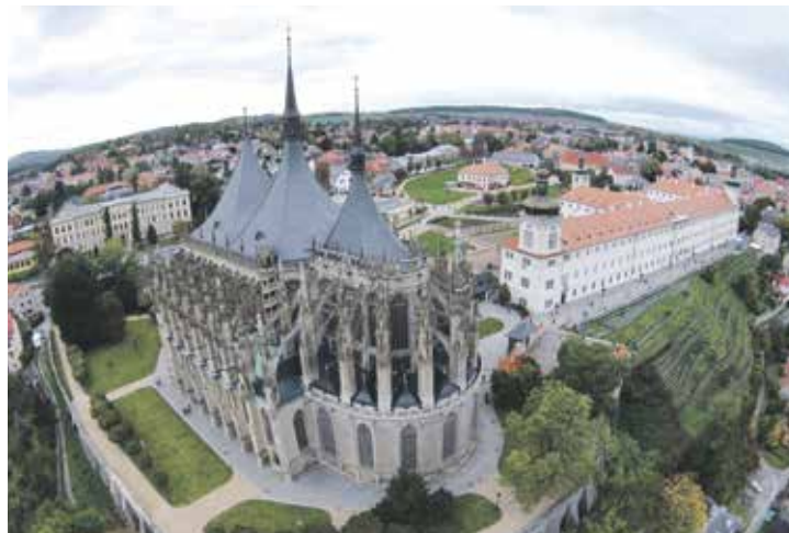
Chrám svaté Barbory v Kutné Hoře.

Stavba chrámu začala roku 1388 a byla několikrát přerušena. Do stavby zasáhly husitské války i další konflikty. Jeho podoba je výsledkem práce významných stavitelů, například Matěje Rejska a Benedikta Rejta. Každé období zanechalo na chrámu svou