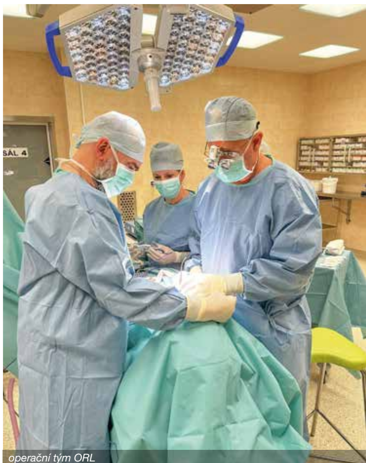
operační tým ORL