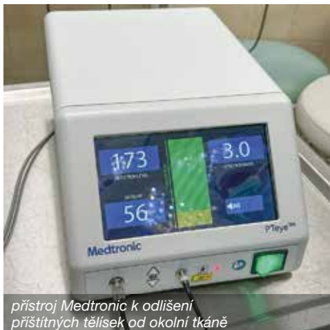
přístroj Medtronic k odlišení příštítných tělísek od okolní tkáně

Speciální přístroj přispívá k maximálně šetrnému operačnímu výkonu bezpečným odlišením příštítných tělísek od okolní tkáně. Využívá technologii laserové fluorescenční sondy. Příštítná tělíska po ozáření speciální vlnovou délkou světla vydávají vlastní záření (autofluorescence), které sonda zachytí, a tím je spolehlivě odliší například od tukové tkáně.