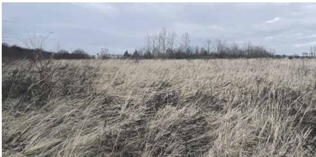
Lokalita bývalé skládky.

Téma se však znovu otevřelo v souvislosti s úvahami o možném budoucím využití lokality. Městská část si již v minulých letech nechala zpracovat zastavovací studii, která upozorňovala, že před jakoukoliv výstavbou bude nezbytné provést podrobný hydrogeologický průzkum a zároveň zpracovat detailní posouzení vlivů na životní prostředí. Na základě těchto podkladů byla následně podána žádost o změnu územního plánu umožňující veřejnou vybavenost