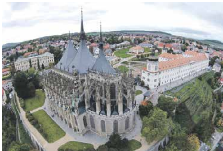
Chrám svaté Barbory v Kutné Hoře.

Stavba chrámu začala roku 1388 a byla několikrát přerušena. Do stavby zasáhly husitské války i další konflikty. Jeho podoba je výsledkem práce významných stavitelů, například Matěje Rejska a Benedikta Rejta. Každé období zanechalo na chrámu svou