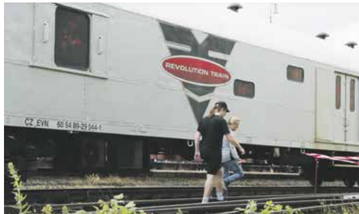
Protidrogový vlak vsází na zážitkovou pedagogiku.

Projekt nadace Nové Česko ukazuje prevenci závislostí pomocí zážitkové pedagogiky. Dosud si jej prohlédlo přes 350 tisíc lidí