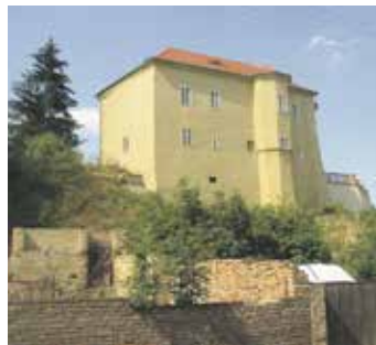
Tvrz Brozany nad Ohří.

Před zámkem si všimnete pozůstatků šijového příkopu. Interiéry nabízejí nahlédnutí do života někdejšího šlechtického sídla