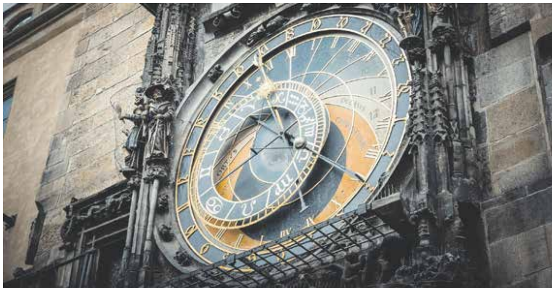
Hlavní město zahájí pravidelnou údržbu soch Staroměstského orloje.