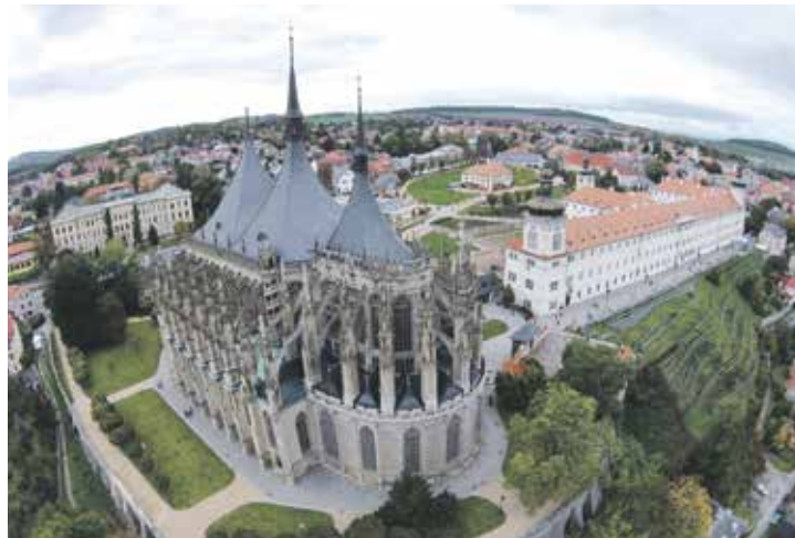
Chrám svaté Barbory v Kutné Hoře.

Stavba chrámu začala roku 1388 a byla několikrát přerušena. Do stavby zasáhly husitské války i další konflikty. Jeho podoba je výsledkem práce významných stavitelů, například Matěje Rejska a Benedikta Rejta. Každé období zanechalo na chrámu svou