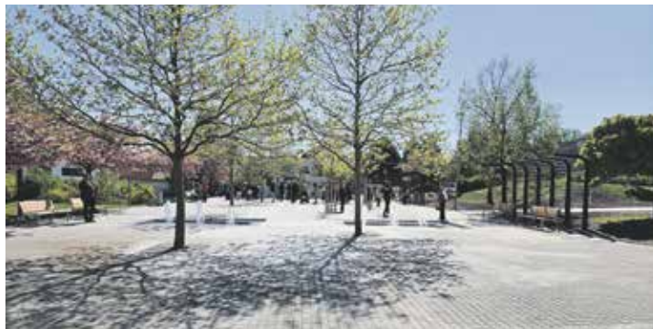
V Horních Měcholupech mají hotový park u hasičárny.

Obyvatelé Horních Měcholup mají novou fontánu u hasičské zbrojnice v Holoubkovské ulici. Úřad mezitím chystá úpravu nedaleké bývalé návsi. Z prostoru zmizela nevyužívaná tržní plocha, kterou nahradily stromy a vodní prvek. Staré stánky si odvezly školy. Pomník obětem světových válek se přesunul blíž ke své historické poloze. „U hasičské zbrojnice jsme pro vás nechali vybudovat moderní vodní prvek, který, jak pevně věřím, vdechne tomuto místu nový život a bude dělat radost všem generacím, od těch nejmenších až po seniory,“ říká starosta Michal Fischer.