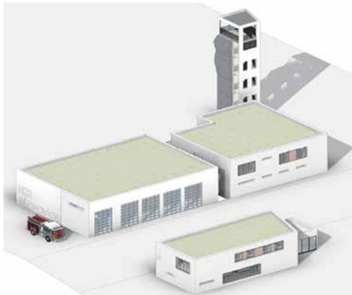
Celý areál navazuje na nově plánovanou silnici I/12. Vizualizace | Praha.eu

Původní plán počítal s tím, že město zafinancuje obě části. Podle schválené dohody pražský magistrát vybuduje pouze stanoviště pro záchranáře. Výstavbu hasičské stanice zajistí samotný sbor z prostředků státu. Město proto hasičům smluvně postupuje pozici stavebníka, příslušnou projektovou dokumentaci nutnou pro výběr zhotovitele, vydané územní rozhodnutí i platné stavební povolení. Pražská část projektu ponese úřední název Stanoviště ZZS