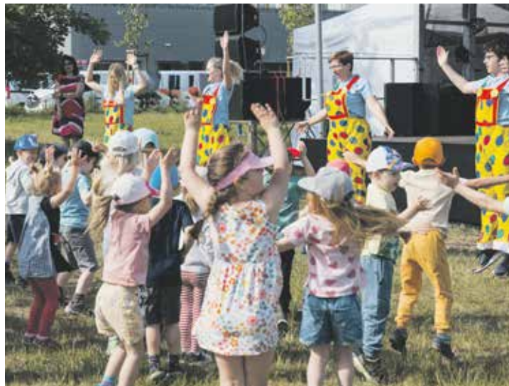
Ilustrační foto | MČ Praha 9

Děti čeká sportovní odpoledne s řadou disciplín a soutěží, dále hudební a taneční vystoupení, pohádka pro nejmenší i oblíbený skákací hrad. Připraven je také zážitkový „jeden den na